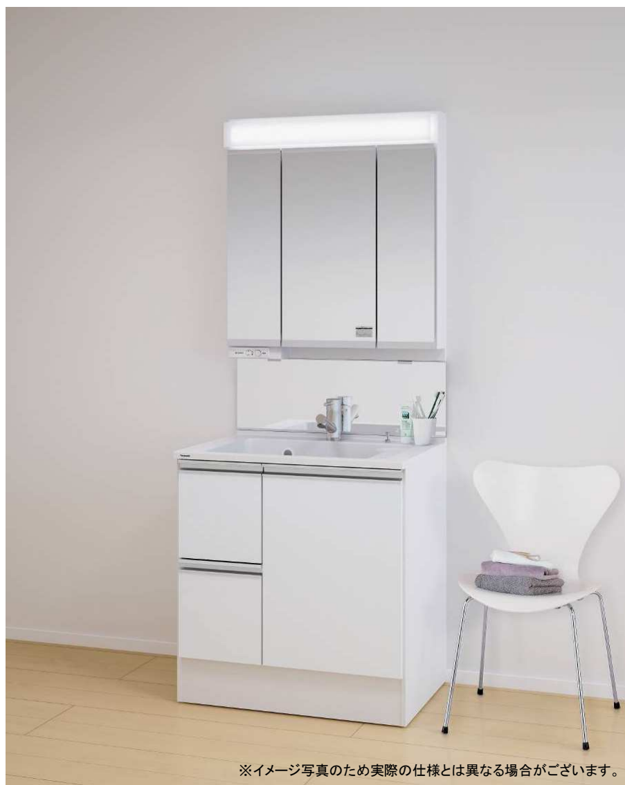
※イメージ写真のため実際の仕様とは異なる場合がございます。