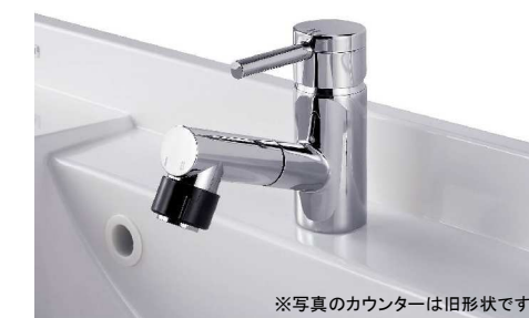
※写真のカウンターは旧形状です。