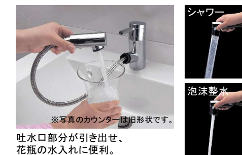
※写真のカウンターは旧形状です。吐水口部分が引き出せ、花瓶の水入れに便利。